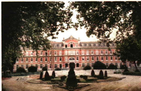
Vidago emprega mais de uma centena e quer fazer renascer o esplendor das termas

o Parque de Vidago, propriedade da Unicer, vai ser inaugurado oficialmente a 6 de Outubro próximo, data que assinala os 100 anos da abertura do Vidago Palace Hotel. No entanto, o hotel, bem como um campo de golfe de 18 buracos, abre já em Julho em regime de soft opening, sendo inaugurado no centenário, em Outubro.