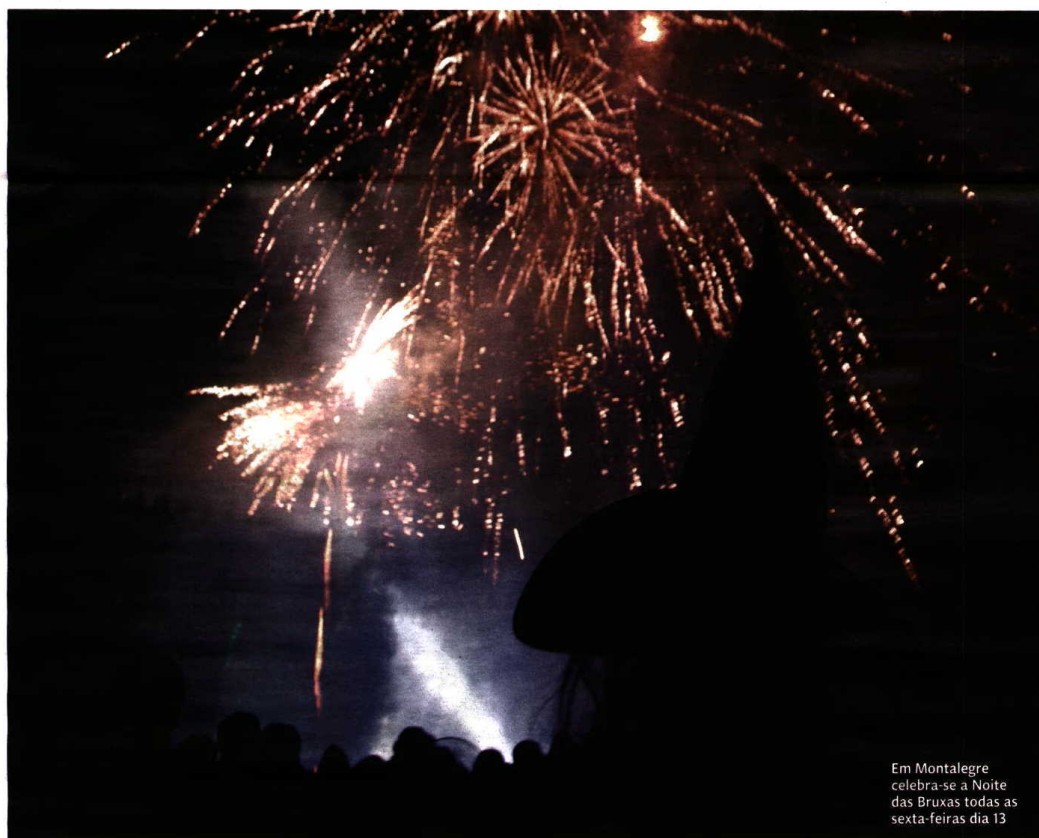
Em Montalegre celebra-se a Noite das Bruxas todas as sexta-feiras dia 13

Tradições populares convertem-se em novas atrações turísticas